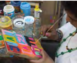
ELOÍSA CARTONERA, Production of books, 2008

Die Ausstellung zeigt Arbeiten von zwölf zeitgenössischen Künstlern und Künstlerkollektiven aus Argentinien, die ihre soziopolitische Umgebung als Terrain der Reflexion und Aktion begreifen und nutzen. Sie veranschaulichen investigative Prozesse, in denen sich Gegenwart, jüngste Vergangenheit und Tradition vereinigen. Die Komplexität der sozialen, politischen und geographischen Gegebenheiten des Landes durchdringt die Arbeiten. In ihnen spiegeln sich städtische und ländliche Lebensrhythmen, das Erbe der Immigranten und der indigenen Bevölkerung, der soziale Wandel und politische Konflikte wider.