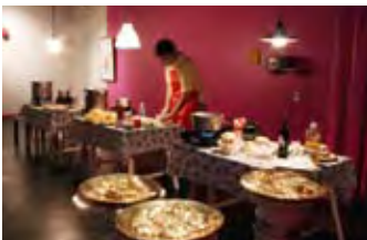
Gabriel Baggio, Lo dado (What has been given), 2006