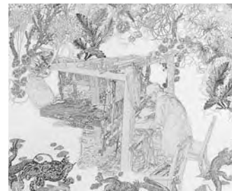
MÓNICA MILLÁN, If I Earn Little I Eat Little, If I Earn Too Much I Eat Too Much (detail), 2008

The exhibition presents the production of twelve Argentine artists and artistic groups that deal with their socio-political environments as a space for reflection and action. Their works are the result of research processes that combine the present, traditions and recent history. The geopolitical complexity of the country permeates these works, in which the urban and rural rhythms are perceived, as well as the immigrant and indigenous heritage, transformations and political conflicts.