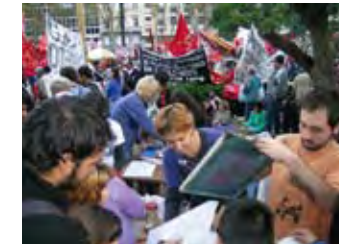
TALLER POPULAR DE SERIGRAFÍA (TPS), Printing during 1st of May Day, May Square, Buenos Aires, 2004

This exhibition displays these practices through works that oscillate between artistic and cultural production, where the human factor is ever-present. Some touch upon situations of resistance, change, development or adoption of a concrete form; others do so in a poetic or metaphoric manner. The narrative of the exhibition is based on the articulation of these practices; a commentary about Argentina nowadays from the viewpoint of its artists.