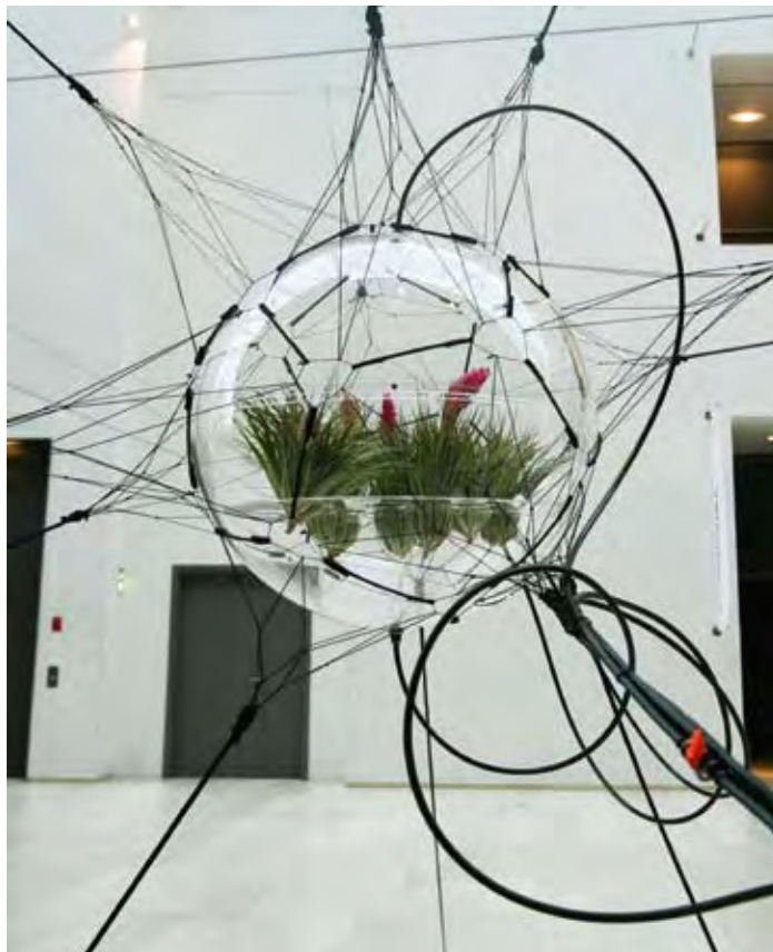
TOMÁS SARACENO, Biosphere, Installation view Statens Museum for Kunst, Copenhagen, Denmark (detail), 2009

For informations on further events see: www.fkv.de